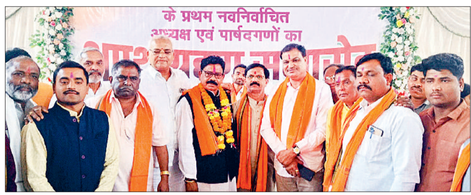
के प्रथम नवनिर्वाचित अध्यक्ष एवं पार्षदवर्गों का शपथ ग्रहण समारोह

हरिभूमि न्यूज डोंगरगांव ग्राम पंचायत से नगर पंचायत का दर्जा हासिल करने वाले लाल बहादुर नगर में नव निर्वाचित अध्यक्ष सहित 15 पार्षदों ने सोमवार को शपथ ग्रहण किया।