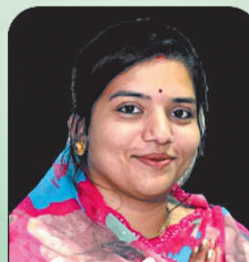
शैव्या वैष्णव पार्षद