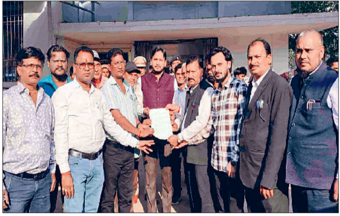
12 सालों से बाईपास अधूरा, हादसों को दे रहा न्योता

शहर में भारी मालवाहक वाहनों के बेरोकटोक आवागमन से सड़क हादसों का सिलसिला थमने का नाम नहीं ले रहा है। बीते सात दिनों में दो दर्दनाक सड़क दुर्घटना में दो लोगों की मौत हो चुकी है। पहला हादसा अमलीपारा में हुआ जहाँ सड़क पार कर रहे एक व्यक्ति को धान से लदे ट्रक ने कुचल दिया, जिससे उसका शरीर दो टुकड़ों में बंट गया और मौके पर ही उसकी दर्दनाक मौत हो गई। वहीं, दूसरा भीषण हादसा रविवार को सांस्कृतिक भवन पास हुआ। प्रत्यक्षदर्शियों के मुताबिक पहले दो बाइक सवार आपस में टकराकर सड़क पर गिरे इसी दौरान एक युवक धान से भरे मेटाडोर की चपेट में आ गया जिससे उसके सिर में गंभीर चोट लगी और मौके पर ही उसकी मौत हो गई। हादसे के बाद मेटाडोर चालक मौके से फरार हो गया जिसकी तलाश में पुलिस जुटी हुई है। गौरतलब है कि शहर में बढ़ती सड़क दुर्घटना अब गंभीर समस्या बन चुकी है। प्रशासन की लापरवाही और बाईपास सड़क का अधूरा निर्माण लोगों की जान पर भारी पड़ रहा है। प्रशासनिक अनदेखी से लगातार निर्दोष हादसों में जान गंवा रहे हैं इस स्थिति में प्रशासन को ठोस कदम उठाने की आवश्यकता है।