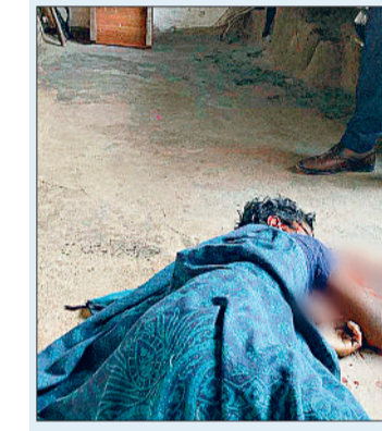
मामले की गंभीरता को देख पुलिस ने दिखाई तत्परता